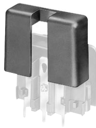
E.g. Rear cover for GSF1