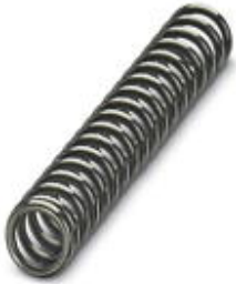
Coil spring for Lock & Release lever for ME-IO housing

Please be informed that the data shown in this PDF Document is generated from our Online Catalog. Please find the complete data in the user's documentation. Our General Terms of Use for Downloads are valid ( http://phoenixcontact.com/download )