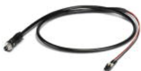
GOF MM cable, assembled with M12 OPTIC to LC duplex

Assembled FO cable, round cable, 50/125 µm GOF-MM fiber, M12 to LC duplex, for installation inside housing