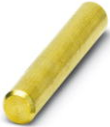
Connection pin, for engaging several base elements to form one unit; 12 necessary per element.

Please be informed that the data shown in this PDF Document is generated from our Online Catalog. Please find the complete data in the user's documentation. Our General Terms of Use for Downloads are valid ( http://phoenixcontact.com/download )