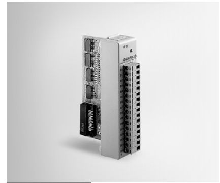
ADAM-5051 ADAM-5051D ADAM-5051S