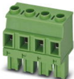
PCB connector, number of positions: 4, pitch: 7.62 mm, connection method: Screw connection with tension sleeve, color: gray, contact surface: Tin

Please be informed that the data shown in this PDF Document is generated from our Online Catalog. Please find the complete data in the user's documentation. Our General Terms of Use for Downloads are valid ( http://phoenixcontact.com/download )