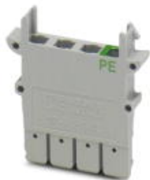
Connector housing, Length: 31.6 mm, Width: 5.2 mm, Height: 31.7 mm, Number of positions: 1, Color: gray

Please be informed that the data shown in this PDF Document is generated from our Online Catalog. Please find the complete data in the user's documentation. Our General Terms of Use for Downloads are valid ( http://phoenixcontact.com/download )