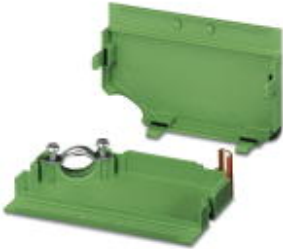
Cable housing, Pitch: 5 mm, Number of positions: 16, Dimension a: 80 mm, Color: green

Please be informed that the data shown in this PDF Document is generated from our Online Catalog. Please find the complete data in the user's documentation. Our General Terms of Use for Downloads are valid ( http://download.phoenixcontact.com )