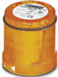
LED blinking light element, 24 V AC/DC, yellow

Please be informed that the data shown in this PDF Document is generated from our Online Catalog. Please find the complete data in the user's documentation. Our General Terms of Use for Downloads are valid ( http://phoenixcontact.com/download )