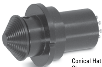
Conical Hat Shown

0.750" DIAMETER FLANGE MOUNT, SHORT TRAVEL