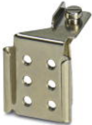
Screw holder, for storing a maximum of 6 switch screws of the ISSB 10-8

Please be informed that the data shown in this PDF Document is generated from our Online Catalog. Please find the complete data in the user's documentation. Our General Terms of Use for Downloads are valid ( http://phoenixcontact.com/download )