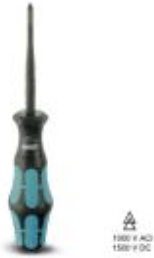
Screwdriver, crosshead PZ (lasered), insulated, size: PZ 1 x 80, 2-component handle, with non-slip grip

Please be informed that the data shown in this PDF Document is generated from our Online Catalog. Please find the complete data in the user's documentation. Our General Terms of Use for Downloads are valid ( http://download.phoenixcontact.com )