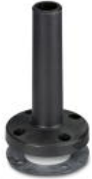
Foot with integrated tube, 110 mm long, black

Please be informed that the data shown in this PDF Document is generated from our Online Catalog. Please find the complete data in the user's documentation. Our General Terms of Use for Downloads are valid ( http://phoenixcontact.com/download )