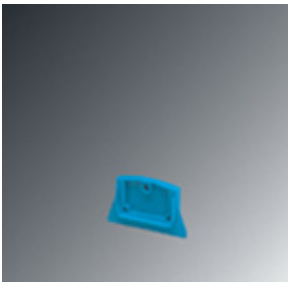
End cover, Length: 42.7 mm, Width: 4 mm, Color: blue

Please be informed that the data shown in this PDF Document is generated from our Online Catalog. Please find the complete data in the user's documentation. Our General Terms of Use for Downloads are valid ( http://phoenixcontact.com/download )