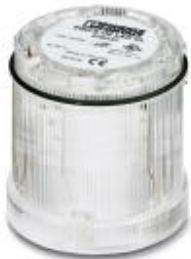
LED permanent light element, 24 V AC/DC, clear

Please be informed that the data shown in this PDF Document is generated from our Online Catalog. Please find the complete data in the user's documentation. Our General Terms of Use for Downloads are valid ( http://phoenixcontact.com/download )