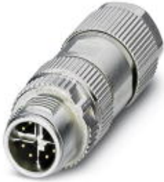
M12 connector, CAT6<sub>A</sub>, connector, straight, 8-pos., shielded, for cable diameters of 4 mm ... 8 mm

Please be informed that the data shown in this PDF Document is generated from our Online Catalog. Please find the complete data in the user's documentation. Our General Terms of Use for Downloads are valid ( http://download.phoenixcontact.com )