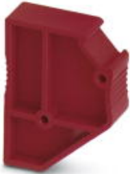
Spacer plate, Length: 22.4 mm, Width: 8.2 mm, Height: 29 mm, Number of positions: 1, Color: red

Please be informed that the data shown in this PDF Document is generated from our Online Catalog. Please find the complete data in the user's documentation. Our General Terms of Use for Downloads are valid ( http://phoenixcontact.com/download )