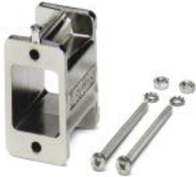
Spacer for panel mounting frames

Please be informed that the data shown in this PDF Document is generated from our Online Catalog. Please find the complete data in the user's documentation. Our General Terms of Use for Downloads are valid ( http://phoenixcontact.com/download )