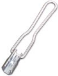
The illustration shows version QSS 22

Socket wrench, for tightening and unscrewing the QUICKON union nut, wrench size 19 mm