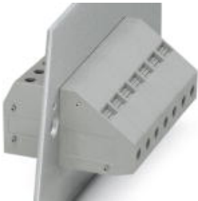
The illustration shows the gray version

Please be informed that the data shown in this PDF Document is generated from our Online Catalog. Please find the complete data in the user's documentation. Our General Terms of Use for Downloads are valid ( http://download.phoenixcontact.com )