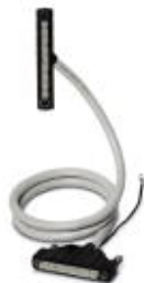
Assembled round cable with two molded 50-pos. socket strips (1:1 connection). Cable length: 18.0 m

Please be informed that the data shown in this PDF Document is generated from our Online Catalog. Please find the complete data in the user's documentation. Our General Terms of Use for Downloads are valid ( http://phoenixcontact.com/download )