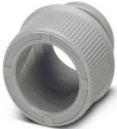
End sleeves as cable protection

Please be informed that the data shown in this PDF Document is generated from our Online Catalog. Please find the complete data in the user's documentation. Our General Terms of Use for Downloads are valid ( http://phoenixcontact.com/download )