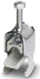
Cable clamp, for DIN rails

Please be informed that the data shown in this PDF Document is generated from our Online Catalog. Please find the complete data in the user's documentation. Our General Terms of Use for Downloads are valid ( http://phoenixcontact.com/download )