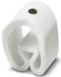
Conductor marking collar, labeled with the symbol: Symbols, white, width: 3.2 mm

Please be informed that the data shown in this PDF Document is generated from our Online Catalog. Please find the complete data in the user's documentation. Our General Terms of Use for Downloads are valid ( http://phoenixcontact.com/download )