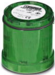
LED permanent light element, 24 V AC/DC, green

Please be informed that the data shown in this PDF Document is generated from our Online Catalog. Please find the complete data in the user's documentation. Our General Terms of Use for Downloads are valid ( http://phoenixcontact.com/download )