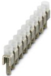
Fixed bridge, Number of positions: 10, Color: silver

Please be informed that the data shown in this PDF Document is generated from our Online Catalog. Please find the complete data in the user's documentation. Our General Terms of Use for Downloads are valid ( http://download.phoenixcontact.com )