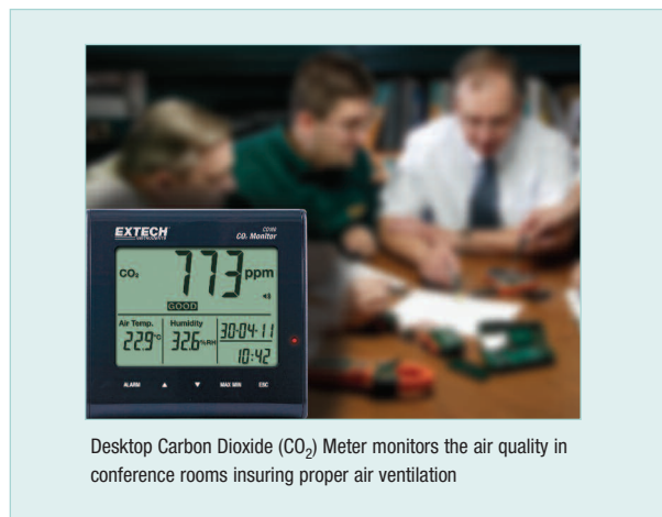
Desktop Carbon Dioxide (CO 2 ) Meter monitors the air quality in conference rooms insuring proper air ventilation