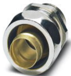
Cable gland made from brass with metric thread, IP65 protection

Please be informed that the data shown in this PDF Document is generated from our Online Catalog. Please find the complete data in the user's documentation. Our General Terms of Use for Downloads are valid ( http://phoenixcontact.com/download )