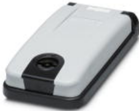
Mounting frame for one front plate/socket, frame: black, cover: gray, closed with 3 mm two-way key bit.

Please be informed that the data shown in this PDF Document is generated from our Online Catalog. Please find the complete data in the user's documentation. Our General Terms of Use for Downloads are valid ( http://phoenixcontact.com/download )