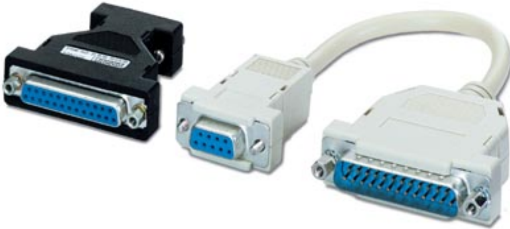
Figure may contain other products.