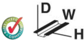
Figure shows PLC-BSC-120UC/21-21/SO46 version

14 mm PLC basic terminal block with screw connection, without relay or solid-state relay, for mounting on DIN rail NS 35/7,5, 2 PDTs, input voltage 48 V DC