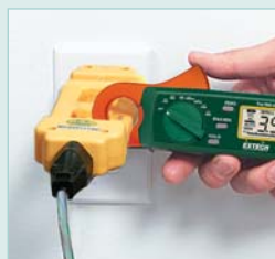
Line separator eliminates the need to cut cords to expose wires