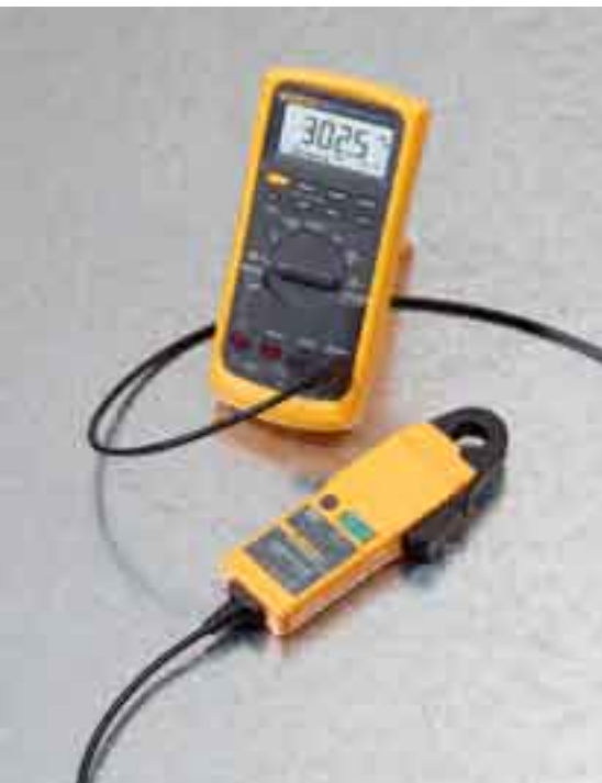
i30 connected to a Fluke 87V Digital Multimeter.

Fluke. Keeping your world up and running.