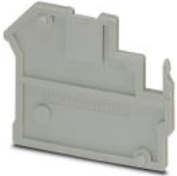
Spacer plate, Length: 47.7 mm, Width: 2.4 mm, Number of positions: 1, Color: gray

Please be informed that the data shown in this PDF Document is generated from our Online Catalog. Please find the complete data in the user's documentation. Our General Terms of Use for Downloads are valid ( http://phoenixcontact.com/download )