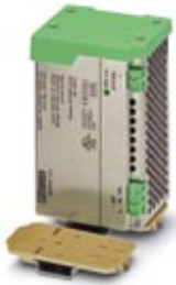
Adapter for mounting QUINT-POWER power supply units, 1 A, 2.5 A, and 5 A, at a 90° angle to the DIN rail

Please be informed that the data shown in this PDF Document is generated from our Online Catalog. Please find the complete data in the user's documentation. Our General Terms of Use for Downloads are valid ( http://phoenixcontact.com/download )