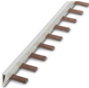
Insertion bridge, Number of positions: 36, Color: gray

Please be informed that the data shown in this PDF Document is generated from our Online Catalog. Please find the complete data in the user's documentation. Our General Terms of Use for Downloads are valid ( http://download.phoenixcontact.com )