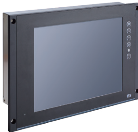
▲ Side view