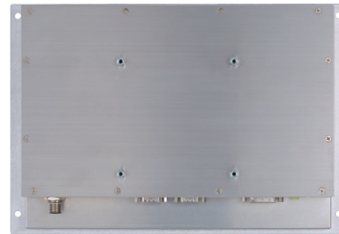
▲ Rear view