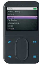
Portable audio player