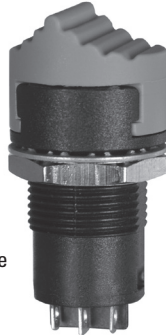
Raised Button Style