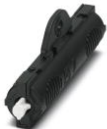
Test pin for SUNCLIX device plug, to check correct positioning of contacts

Please be informed that the data shown in this PDF Document is generated from our Online Catalog. Please find the complete data in the user's documentation. Our General Terms of Use for Downloads are valid ( http://phoenixcontact.com/download )