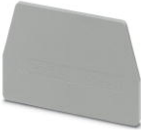
End cover, Length: 61 mm, Width: 2.2 mm, Color: gray

Please be informed that the data shown in this PDF Document is generated from our Online Catalog. Please find the complete data in the user's documentation. Our General Terms of Use for Downloads are valid ( http://download.phoenixcontact.com )