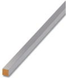
PEN conductor busbar, 6x6 mm, length: 1000 mm

Please be informed that the data shown in this PDF Document is generated from our Online Catalog. Please find the complete data in the user's documentation. Our General Terms of Use for Downloads are valid ( http://phoenixcontact.com/download )