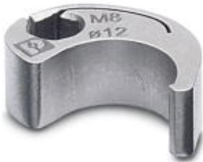
Nut for assembling sensor/actuator cables with M8 connector and for M8 connectors with QUICKON fast connection technology, for 4 mm hexagonal drive

Please be informed that the data shown in this PDF Document is generated from our Online Catalog. Please find the complete data in the user's documentation. Our General Terms of Use for Downloads are valid ( http://download.phoenixcontact.com )