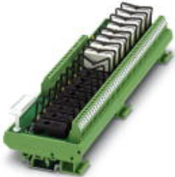
VARIOFACE module, for 16 plug-in miniature relays or miniature optocouplers, with LED, 230 V AC input voltage

Please be informed that the data shown in this PDF Document is generated from our Online Catalog. Please find the complete data in the user's documentation. Our General Terms of Use for Downloads are valid ( http://phoenixcontact.com/download )