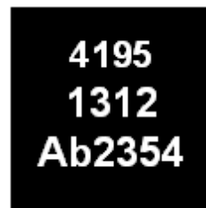
24-L 4x4 mm QFN package

The TGA4195-SM is lead-free and RoHS compliant. Evaluation boards are available upon request.