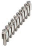
Fixed bridge, Number of positions: 10, Color: silver

Please be informed that the data shown in this PDF Document is generated from our Online Catalog. Please find the complete data in the user's documentation. Our General Terms of Use for Downloads are valid ( http://download.phoenixcontact.com )