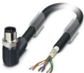
Bus system cable, VARAN, 6-position, PVC, black, shielded, cable length: 10 m, Customer version

Please be informed that the data shown in this PDF Document is generated from our Online Catalog. Please find the complete data in the user's documentation. Our General Terms of Use for Downloads are valid ( http://phoenixcontact.com/download )