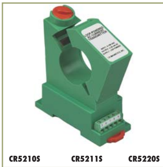
Single Element - 1.2" Window 20 to 300 ADC Input Range

The CR5200 Series, DC Current Transducers are designed to provide a DC signal which is proportional to a DC sensed current. These devices are designed for direct current only, targeting them towards general and daily applications. The ranges 2 to 10 Amp utilize an advanced Magnetic Modulator technology and the ranges 20 amps and above utilize Hall Effect technology.