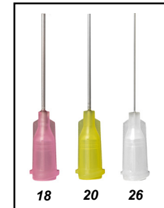
Needle Gauge (GA)