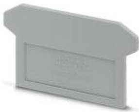
Fuse modular terminal block, Length: 64 mm, Width: 2.5 mm, Color: gray

Please be informed that the data shown in this PDF Document is generated from our Online Catalog. Please find the complete data in the user's documentation. Our General Terms of Use for Downloads are valid ( http://download.phoenixcontact.com )